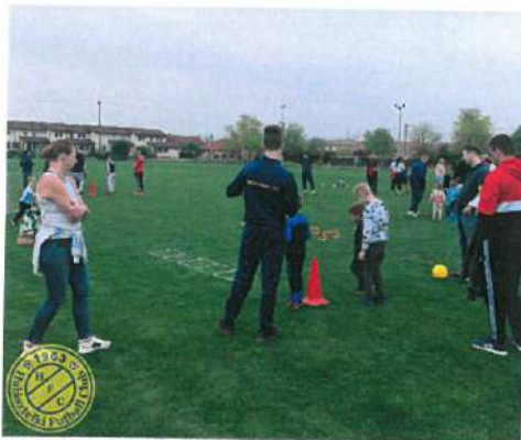
15. Kép: OVI-Foci kóstoló 2022.