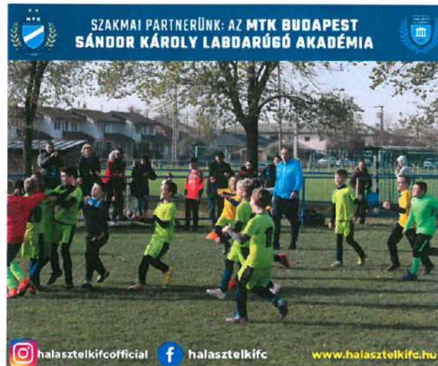
1. Kép: Gólöröm U11 módra a büntetőpárbajt követően

Célunk, hogy családi légkörben és hangulatban megadjuk mindenki számára a lehetőséget a sportolásra, valamint az ügyesebb gyermekeket felkészítsük a magasabb szintű versenysportra.