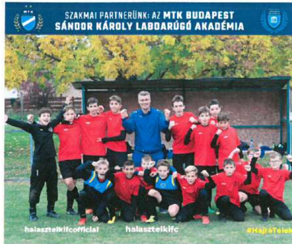
16. Kép: U14-es csapatunk a Vecsés elleni győzelmet követően (2022. őszi)