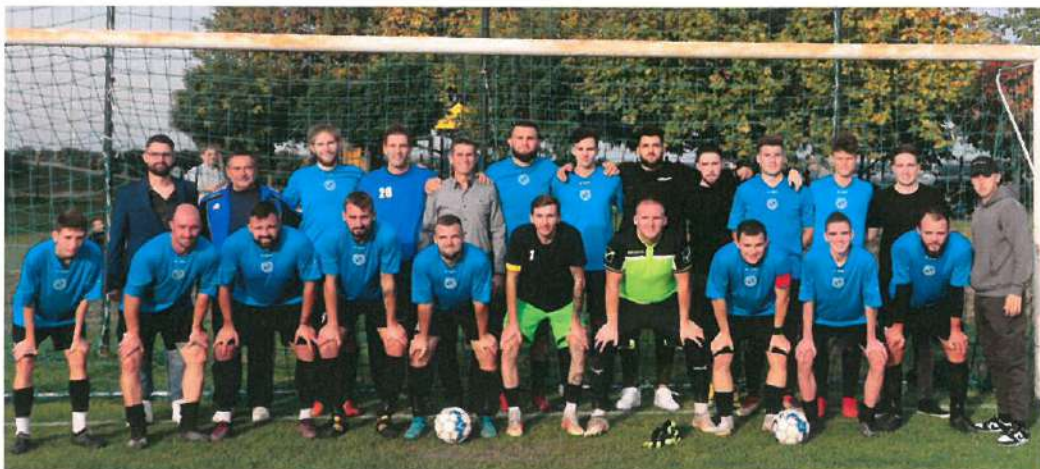
6. Kép: Felnőtt csapatunk az őszi, Dabas elleni győztes mérkőzést követően

Felnőtt csapataink kibővültek a Veterán korosztállyal , így a felnőtt futball után még három korosztályban (öregfiúk, Old boys és veterán) tudnak futballozni a kiöregedő játékosaink.