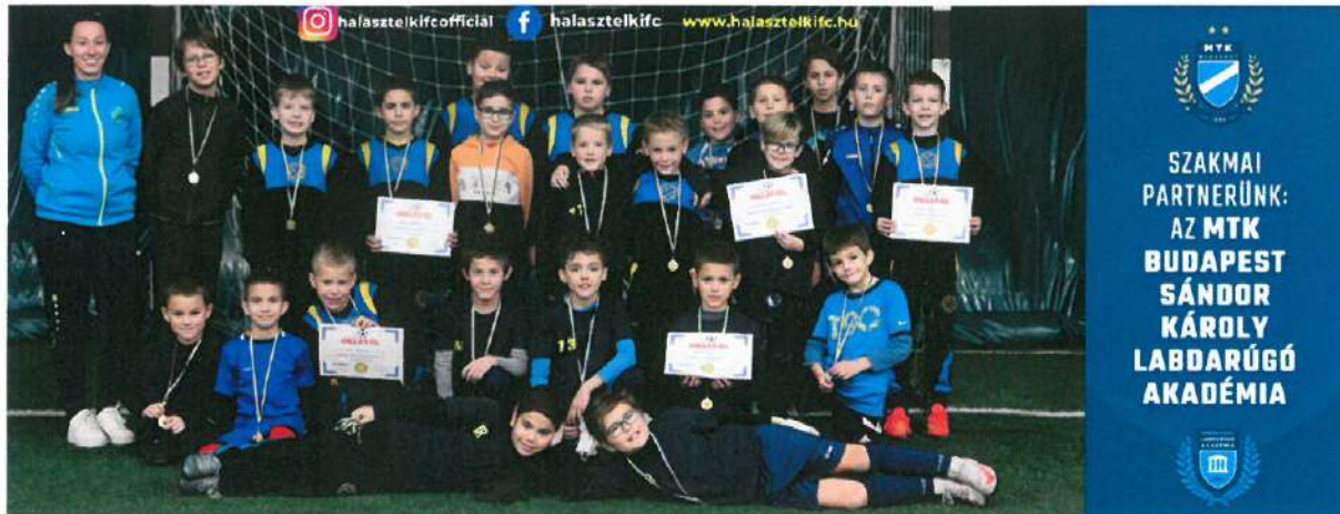
4. Kép: U9-es gólvágóink

Kiugró sikerként könyvelhetjük el az MTK Budapest által rendezett partneregyesületi tornákon való remek szerepléseket ( U7-es tehetségeink ezüstérmet szereztek ), valamint nemzetközi mérkőzésen aratott győzelmet.