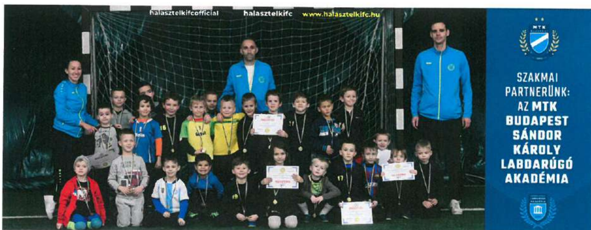
3. Kép: U7-es tehetségeink

A rövid nyári pihenőt követően elindult a következő szezon, amelyet illetően a csapatok létszámában változás következett be. Az U7, U9 és U11-es korosztályok továbbra is megmaradtak, amelyekben az intenzív marketing és kommunikációs kampányok eredményeként megnövekedett létszámmal tudunk edzeni és versenyezni. A Bocsik Fesztiválok mellett immár több színvonalas utánpótlás tornán is elindultunk , valamint rengeteg edzőmeccset játszottak fiataljaink a minél több játéperc érdekében.