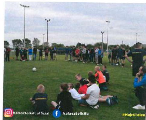
14. Kép: HFC családi nap 2022.