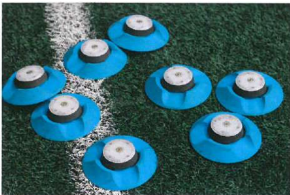
11. Kép: Blazepod innovatív eszköz az U9-es csapat edzésén (2022. március)

A digitális eszközök és alkalmazások ma már mindennapjaink részévé váltak. Az viszont, hogy mindezeket tudatosan és képességeink fejlesztésére használjuk, még egy kellőképpen kiaknázatlan terület.