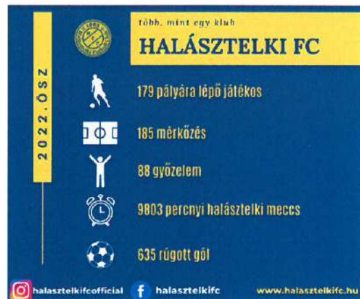
5. Kép: HFC teljesítménye a pályán (2022. ősz)

A tavaszi U13-as csapat helyett U14-es korosztályt indítottunk azért, hogy minden gyermeket versenyeztetni tudjunk . Ezen korosztállyal a Budapest bajnokságba nevezünk, mert megyei megmérettetés ezen korosztálynak nem került kiírásra. Emellett U17-es korosztályunk ismét a regionális küzdelmekben vesz részt, azonban sajnos az U19-es korosztályt nem tudtuk elindítani , mivel a csapat gerincét alkotó tehetséges srácokat leigazolta Dunaharaszti. Nem maradt kellő számú játékosunk, így fájó szívvel, de le kellett mondanunk a csapat versenyeztetéséről (az edzés lehetőségét felajánlottuk azon játékosoknak, akiket nem tudtunk más korosztályban versenyeztetni, azonban nem éltek vele).