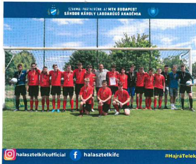
2. Kép: Ezüstérmes U16-os csapatunk

Az MLSZ Regionális bajnokságában versenyző U17-es korosztályunk a 8. helyezést érte el az igen színvonalas megmérettetésben, ahol kifejezetten erős csapatok ellen tudtak helytállni a gyerekek.