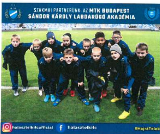
9. Kép: U11-es játékosaink labdaszedőként az MTK-Győr bajnoki mérkőzésen

Hiszünk abban, hogy minden gyermekben ott van a tehetség. Elkötelezettek vagyunk a tekintetben, hogy olyan körülményeket biztosítsunk a Nálunk sportoló fiataloknak, amelyek lehetőséget adnak számukra céljaik elérésében.